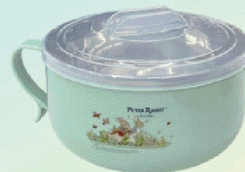
| 比得兔不鏽鋼隔熱餐碗