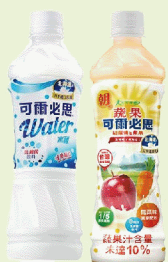
| 可爾必思乳酸菌飲料 (原味、蔬果)