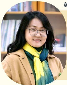
彰化縣文興高級中學