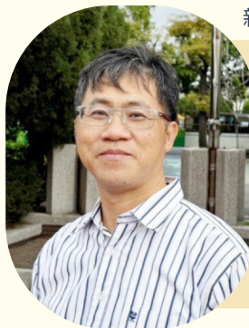
新北市立明志國民中學

TOEIC Bridge測驗專為基礎英語學習者設計，助學生設立明確目標，以前、後測追蹤學習進度。